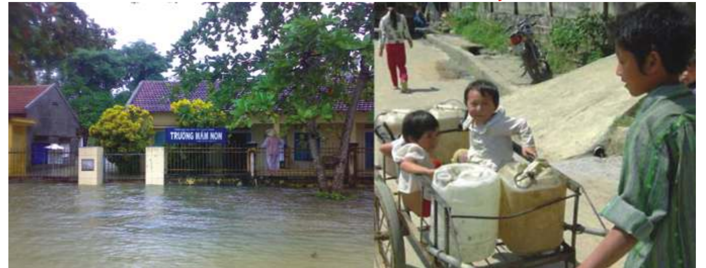
Ngập lụt, không đi học được